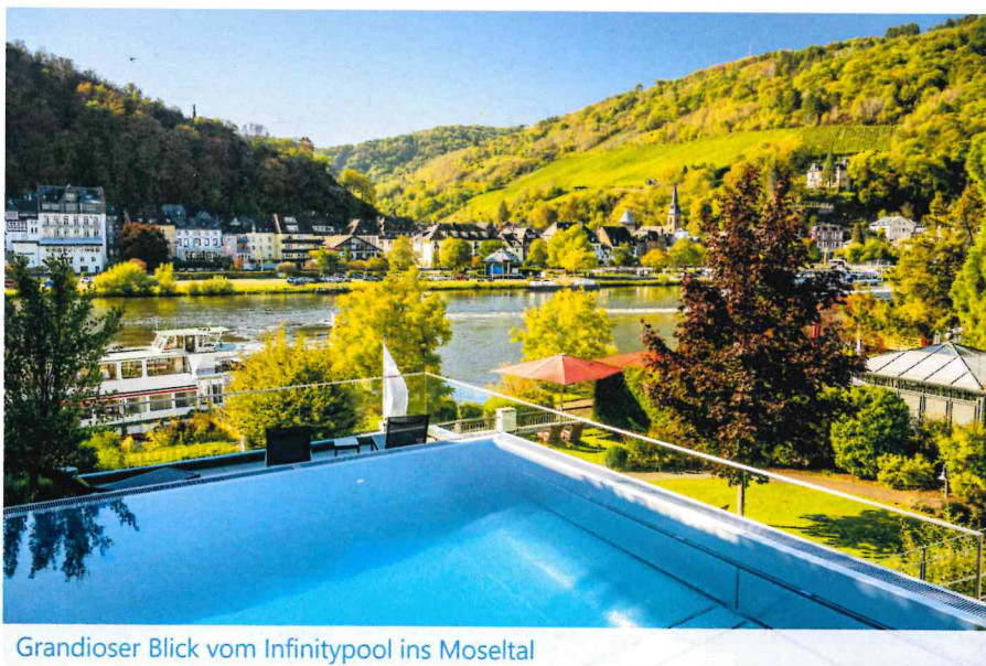
Grandioser Blick vom Infinitypool ins Moseltal

Mosel hat. Die luxuriösen, dick gepolsterten Liegen im gesamten Bereich laden zum Relaxen ein. Ein Treffpunkt ist das SPA-Bistro, in dem zwischen 12:00 und