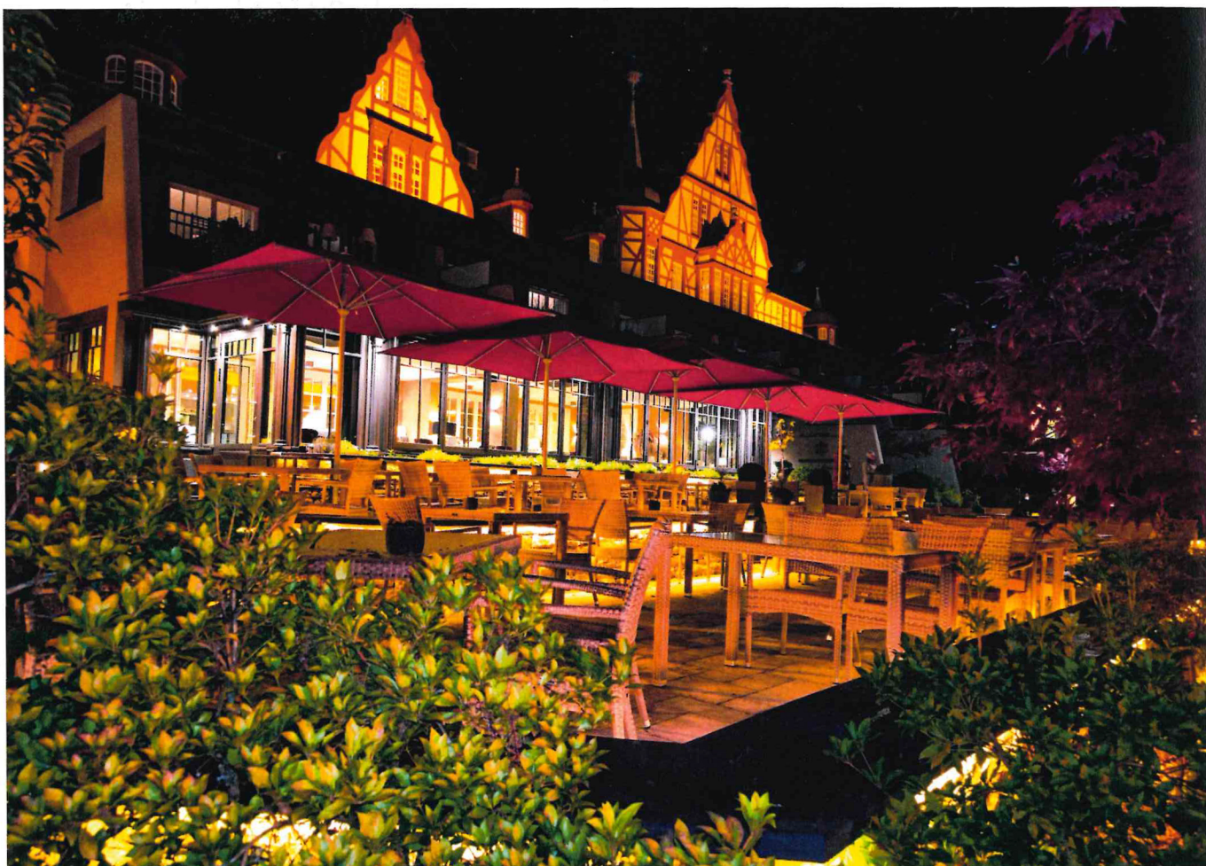
Abendstimmung im Moselschlösschen

W einselige Touristen prägten einst die Dörfer links und rechts der Mosel. Diese Zeiten sind Vergangenheit. Natürlich ist Wein immer noch ein Thema, um die Region zu besuchen, aber der Fokus hat sich verschoben. Heute kommen die Gäste, um sich in Ruhe zu entspannen und die wunderbare Landschaft mit ihren vielfältigen gastronomischen Angeboten und Freizeitaktivitäten