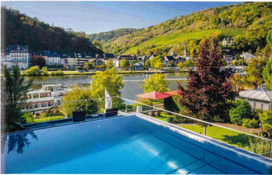
Der Infinity-Pool bietet einen tollen Blick auf das Moseltal

die intensive Hitze der Finnischen-Sauna und die wohlige Wärme der Bio-Sauna auf Körper und Seele wirken – und sich vom magischen Sternenhimmel im Dampfbad verzaubern, während die vitalisierende