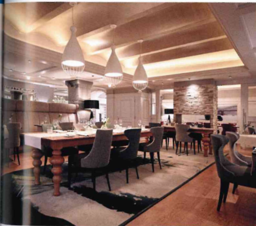
Gemütlich genießen: Blick ins Restaurant

Nähere Infos unter www.moselschloesschen.de