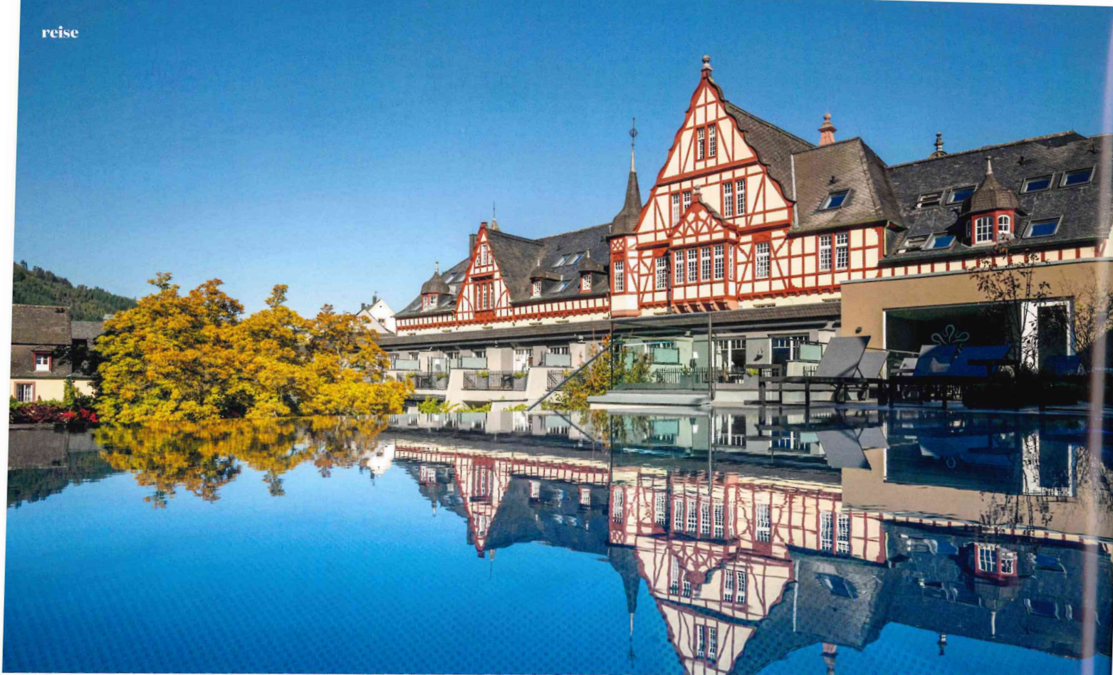
Natur-Idylle trifft Komfort: Das „Moselschlösschen Spa & Resort“ in Traben-Trarbach